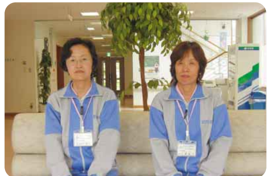
ケアハウスてっせい