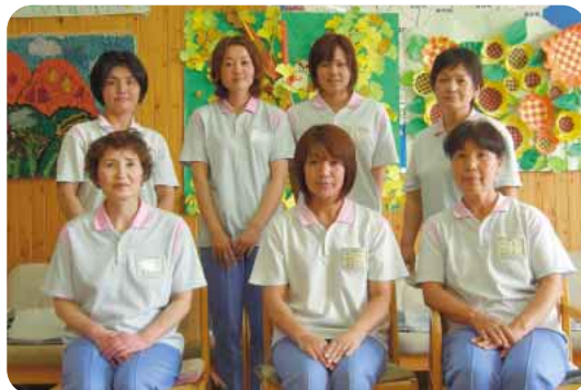
哲西荘デイサービスセンター