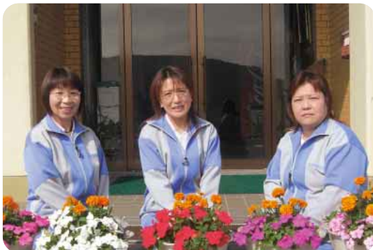
哲西福社会 訪問介護事業所